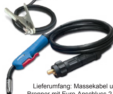
Lieferumfang: Massekabel und Brenner mit Euro-Anschluss 2,2 m.