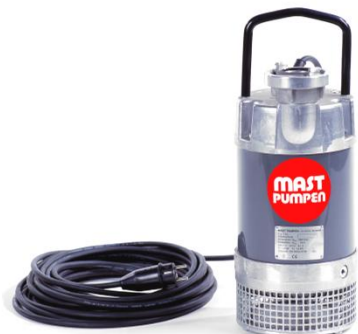
Förderhöhe H m (WS)