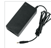
230 V-Ladegerät + Netzleitung