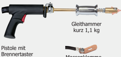
Gleithammer kurz 1,1 kg